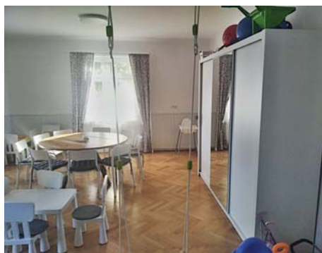
Klub maminek v průběhu oprav a po jejich dokončení