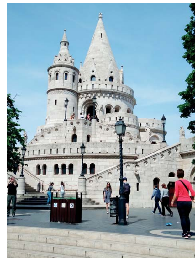
Hradby v Budapešti

chrám, a další. Prostě krásná. Poté jsme navštívili další lázně, tentokrát Harkány, kde jsme pobýli dvě hodiny a den jsme zakončili mší svatou v kostele Navštívení Panny Marie v Mariagyüde nedaleko chorvatských hranic. Při