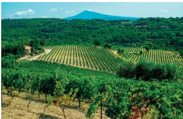
Krajina v Provence

Celý příběh je vlastně podobenstvím, které ukazuje, jak mnoho dobra může vykonat i zdánlivě bezmocný a nedůležitý člověk.