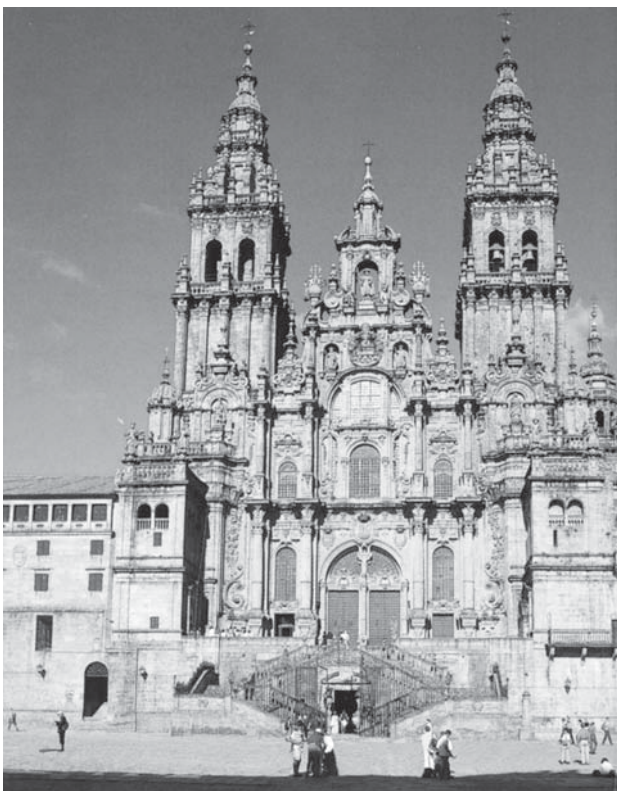
Katedrála v Santiagu de Compostela

považuji za rozhodující do- rodiní pro nové nabytí sil na další den. Když jsme se pana monsignora ještě před nástupem cesty dotazovali, jak je to s možností WC, stroze odpověděl: „WC je prakticky všude!“. Pokud se týká stravy, bylo dobré vzít si sebou nějaké konzervičky, pečivo (bagety) bylo možno vždy dokoupit, ale cestou je i řada drobných restaurací. Někdy jsme si zašli za ně-