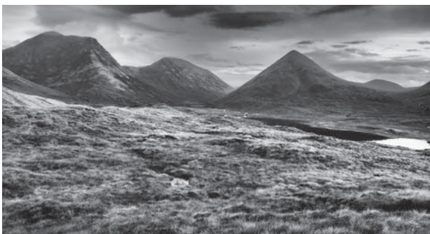
Pohled na jezero, u něhož jsme se setkali s rybářem

Bylo to v situaci, kdy jsme velkou část dne postupovali dlouhým údolím. Krajina typicky skotská: kolem nás skály, vřes, rašeliniště, „stezku“ jsme spíše tušili, než viděli, stále po kotníky v blátě nebo ve vodě. Chvillemi zasvitlo slunce, častěji bylo pod mrakem nebo přeprchalo. Došli jsme k naprosto opuštěnému jezeru. Naskytl se nám překvapivý pohled: několik set metrů od nás plula pramice se stojícím rybářem (jak tam ten dobrý muž loďku dostal, nevím – žádná sjízdná cesta k jezeru nevedla...). Asi bychom šli dál, ale kamarád Petr Bobek, ne nadarmo