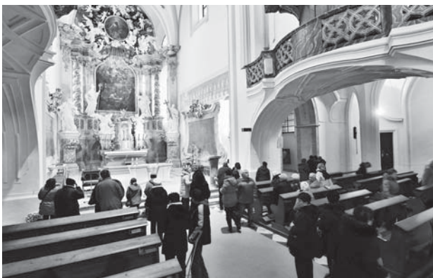
Bazilika Panny Marie ve Žďáře

vítr, snad všichni se jí zúčastnili, i ti se zdravotním omezením.