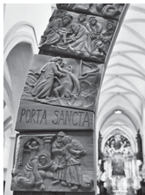
Detail žďárské Svaté brány