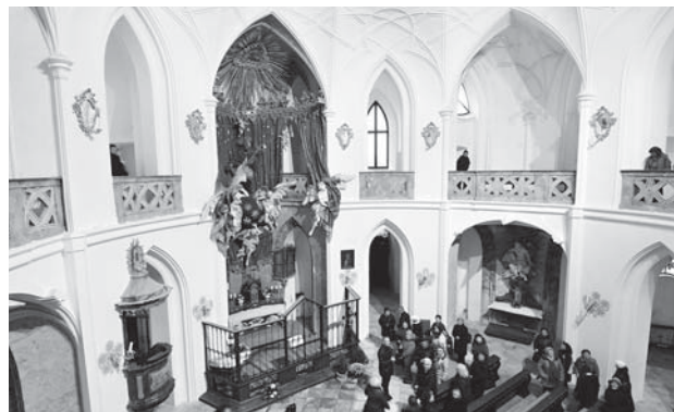
Interiér Santiniho chrámu na Zelené hoře

Během této pouti nám bylo několikrát uděleno