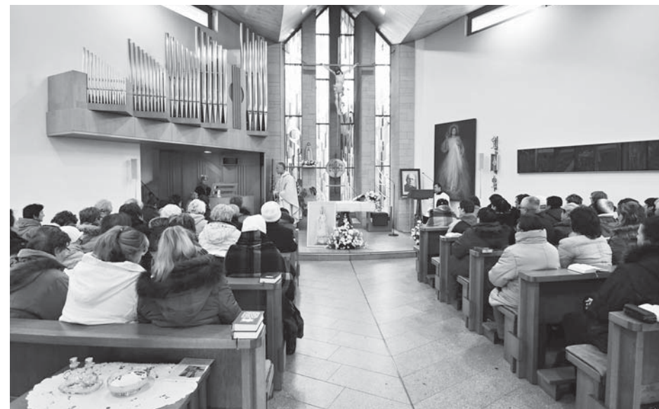
V kostele Božího milosrdenství jsme měli mši svatou

Faustyny Kowalské a doplnil to promítáním fotek. Faustyna už jako šestileté dítě toužila být Ježíši nablízku a šířit lásku, pokoj a Boží milosrdenství, a to i přes to, že pocházela z chudé rodiny, která měla těžký život. Ve zdejším kostele jsou uloženy její ostatky. Povídání to bylo zajímavé a povzbudivé a krásně doplnilo celkovou atmosféru naší pouti. Pak jsme se pomodlili křížovou cestu na kopci nad kostelem, a i když foukal studený