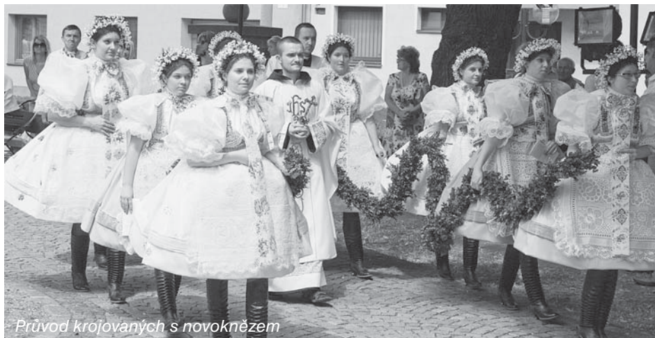
Průvod krojovaných s novoknězem

CESTA ♦ vydává Farní úřad - Farní rada Dolní Bojanovice. Registrováno Okresním úřadem Hodonín pod značkou R 370600593.