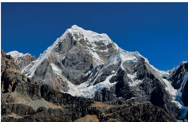
Hora Siula Grande (6344 m.n.m.)

To, co Ježíš vykonal pro záchranu každého z nás, je daleko větší. Ježíš nebojuje za sebe, ale za nás. Ježíšova křížová cesta byla neskonale těžší než cesta, kterou musel překonat Joe na ledovci.