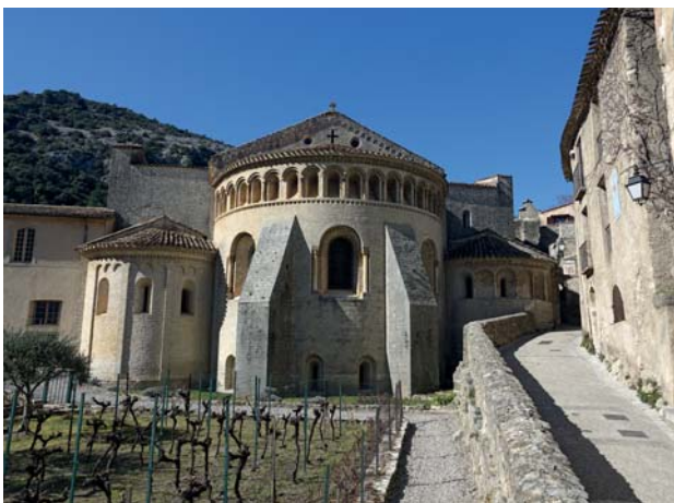
Středověké město Saint-Guilhem-le-Désert

Ve středu jsme cestou do Lurd navštívili komunitu Malých Sester a Bratrů Beránkových, kteří nám pověděli něco o jejich řádu a ukázali nám, jak žijí. Po příjezdu do Lurd jsme se pomodlili růženec k Panně Marii a měli i vlastní mši svatou, kterou sloužil otec Petr v místní kapli. Při ní jsme prosili za všechny naše rodiny a blízké, za farnost a také za mladé z komunity JL. V Lurdech se nachází nádherná křížová cesta v životní velikosti, kterou jsme si s modlitbou prošli. Rozdělili jsme si zastavení a každý přidal i svůj komentář.