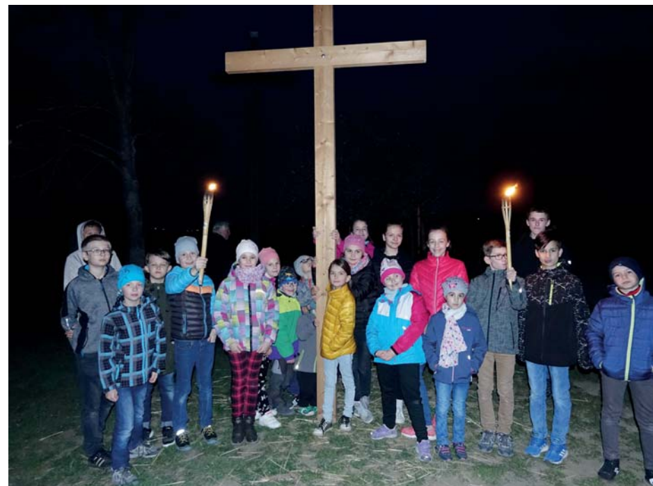
Část dětských účastníků letošní křížové cesty k misijnímu kříži (konala se 5. dubna)

Pozn.: Jako vždy je možné si v sakristii objednat CD se všemi přednáškami.