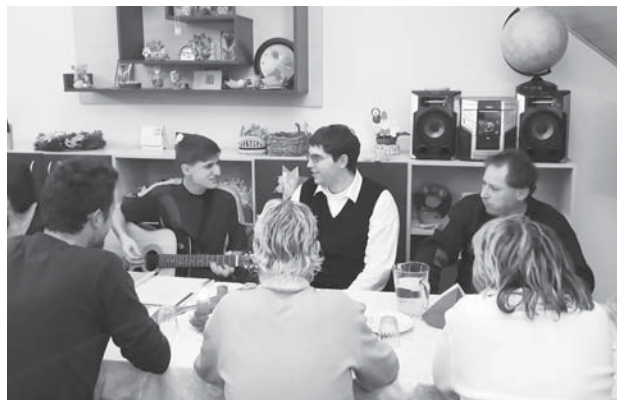
Při setkáních Alfě vládla příjemná atmosféra

hodonínské farnosti, která akci připravila, včetně výborného občerstvení.