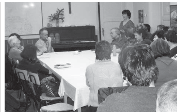
Jedno ze setkání letošního kurzu Charismatické obnovy