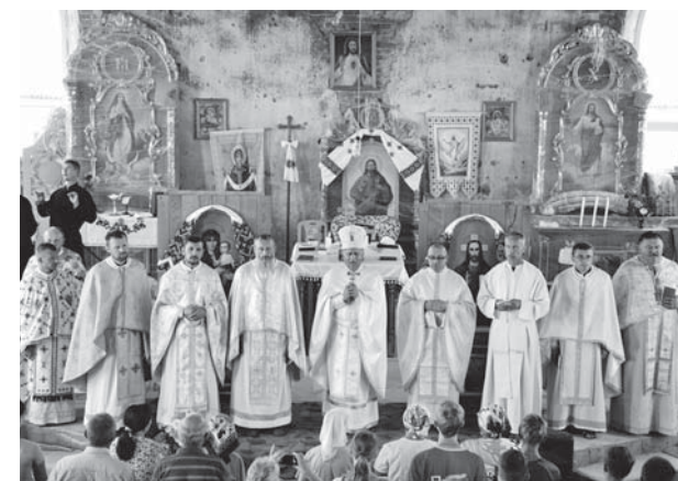
Kostel ve Sněhurivce - slavnostní mše

Pro mši svatě bylo povídání o. Petra pro nás dospělé