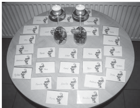
Pro každého příchozího byly připraveny vizitky

Loni jsem se účastnil Alfy jako host. Letos jsem přijal službu vedoucího skupinky. Je to úžasné, jak naši hosté postupně poznávají