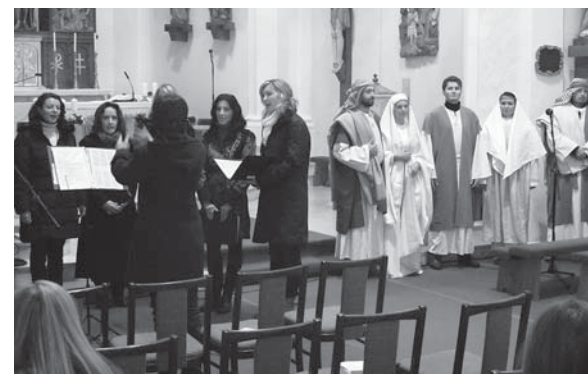
V sobotu 30. listopadu se v našem kostele uskutečnilo adventní pásmo písní a recitace pod názvem Očekávání