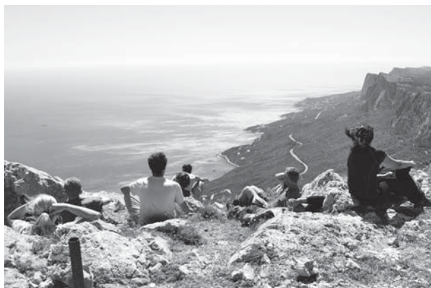
Krásné výhledy na Černé moře