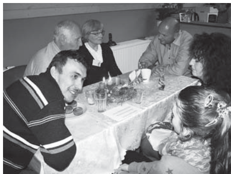
Diskuze o přestávce

Pravdu. Jak se mění a hledají odpovědi na miliony otázek, které přináší každá přednáška. Je to pro mě velkým povzbuzením. Ale na druhou stranu si uvědomuji, že naše úsilí spojené se službou druhým nestačí. Moc jsem si uvědomoval sílu modlitby a působení Ducha svatého nejenom na účastníky, ale i na sebe. Děkuji vám všem, kdo jste se za nás i za účastníky modlili.