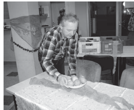
Stoly připravovali hodonínští farníci

Na Alfě jsem sloužila letos i loni jako vedoucí skupinky. A opět se z nás, vedoucích, hostů a technického týmu stali přátelé. Parta lidí, kteří by mohli doma pod dekou sledovat seriál, ale raději se každou středu modlí za