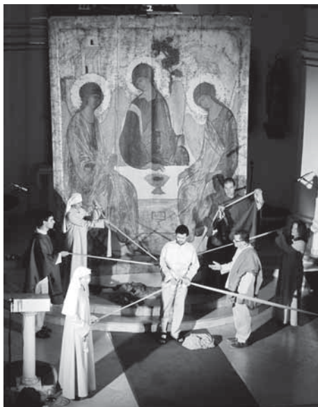
Z divadelního představení Zraněný pastýř

Nevím, zda jsem měl pravdu, ale mně to náhle došlo: můj prožitek strachu a tísně mohl být