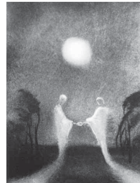
Bedříška Znojemská, Setkání