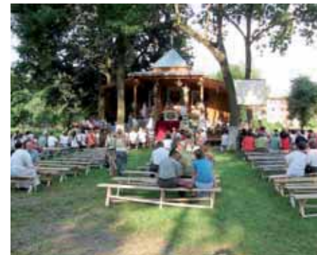
Pouť na Ukrajinu