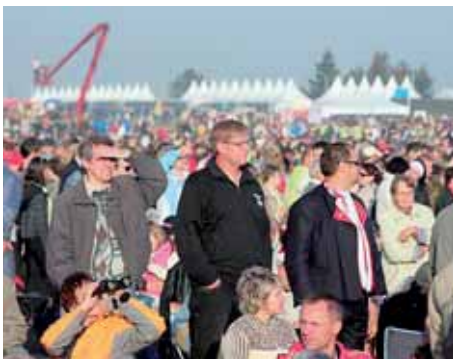
Návštěva papeže Benedikta XVI.