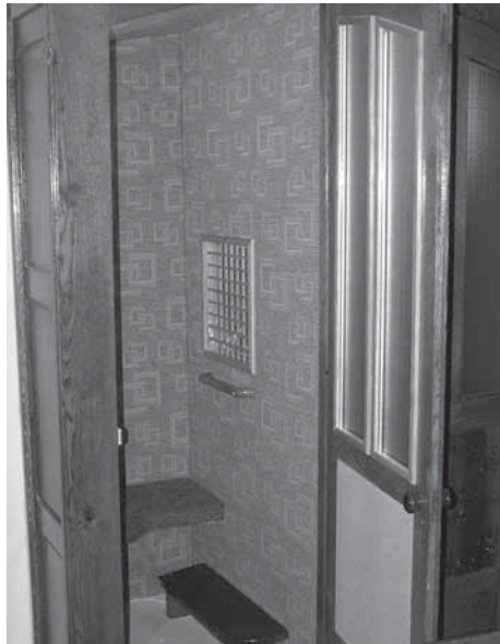
Na fotografii vlevo vidíte (zatím) neopravenou zpovědnici, vpravo je zpovědnice po úpravě (nová dlažba, elektroinstalace, skleněná výplň dveří, odhlučnění ...). Rozdíl lépe posoudíte při osobní návštěvě ...

John Farndon: Školní encyklopedie (EN – ENCYKLOPEDIJE)