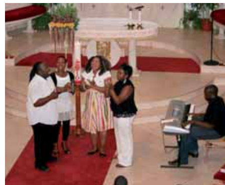
Gospel u nás