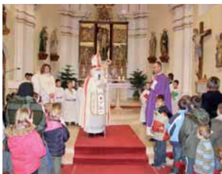
Návštěva z nebes