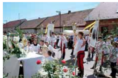
První svaté přijímání