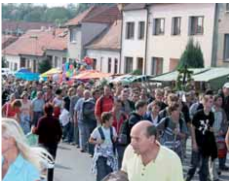
Zlatá sobota v Žarošicích