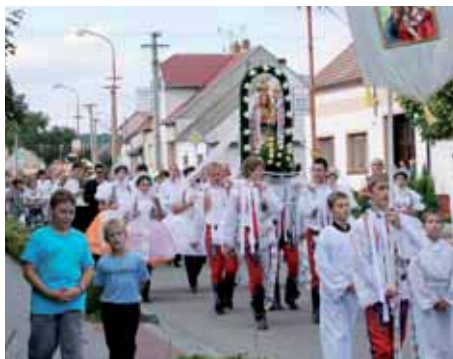
Vítání poutníků ze Žarošic