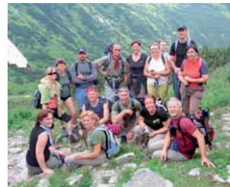
Roháče - dospělí