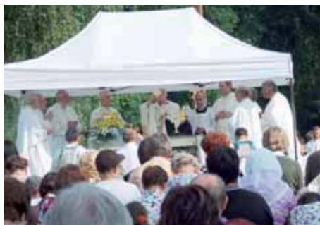
Cyrlometodějská pouť v Mikulčicích