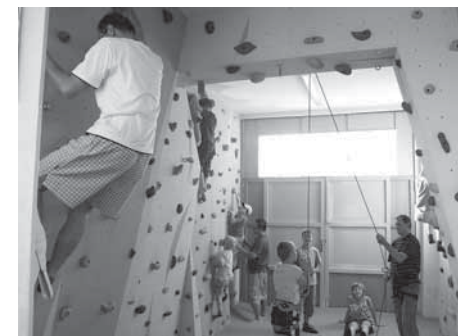
A lezeme, lezeme... po farní stěně