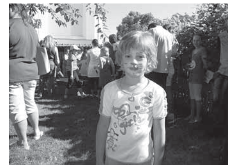
Takhle mě ani mamka nepozná... ☺