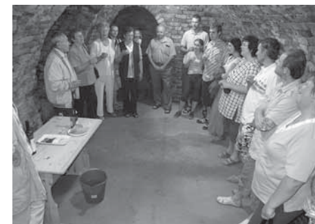
Víněčko bíué... (zpívání ve farním sklepě)