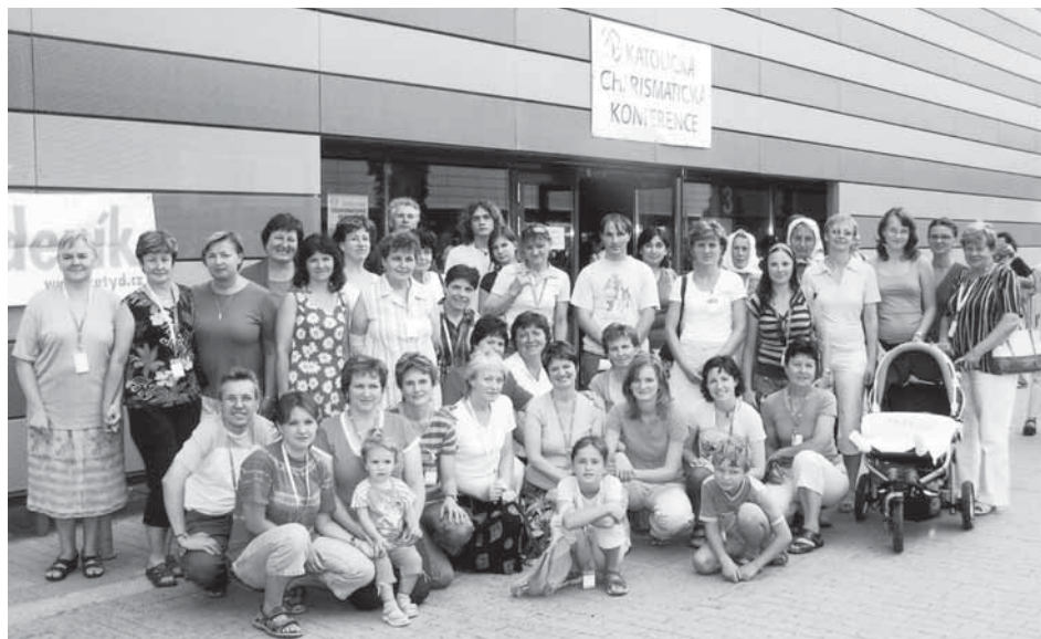
Část bojanovských a josefovských účastníků Konference