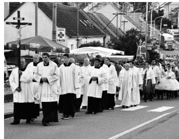
Třináctého června měla naše farnost na starosti organizaci pravidelné „měsíční“ žarošické pouti. Prožili jsme tam společně požehnané chvíle.