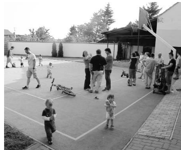
V neděli 19. května se na faře konal táborák Klubu maminek (přítomní byli i tatínci i děti :)).