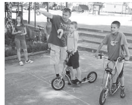
Byla připravena spousta her ...

Opakovala jsem doma tentokrát se všemi dětmi poznatky z přípravy. Probírali jsme na příkladu turisty, který, když jde na náročnou cestu, musí s sebou mít mapu, dobré boty, pití,...co musí mít člověk na cestu k Bohu? – Bibli, modlitbu, sv. přijímání,... Pětiletá dcera přemýšlela, co