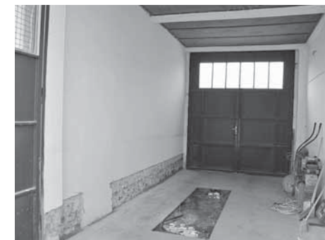
Garáž v původním stavu.

S pracemi bylo započato v březnu. Nejdříve bylo potřeba celou místnost „zkulturnit“ – udělat novou elektroinstalaci, odklonění vedení plynu, dlažbu, sanační omítky, snížení stropu sádkokartonem... Poté přišla na řadu práce na nosné konstrukci, která je tvořena trámkami (8x10 cm) upevněnými na stěně a překrytými vodovzdornou překližkou o tloušťce 2 cm. Před upevněním bylo potřeba do překližky navrtat síť děr vzájemně vzdálených asi 20 cm, do nichž byly z budoucí zadní strany upevněny závitky. Tato „nadmíra“ otvorů (celkem asi 1000) slouží k tomu, aby se umělé kameny mohly libovolně přemisťovat a tím vytvářet nové možnosti lezení. Potom následovalo natření celé stěny barvou a výmalba celé místnosti. Po vyschnutí barvy bylo možné do připravených děr namontovat