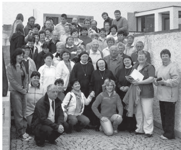
Hromadné foto na památku s řádovými sestrami Exercičního domu Leitershofen

Po celou dobu návštěvy Bavorska jsme byli ubytováni v Exercičním domě Leitershofen na předměstí města Ausburgu. Tady se o nás dobře starala a na všechna navště-