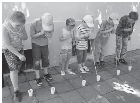
Sobotní odpoledne třetáků a jejich rodin.

Děti hádají jméno Abrahámovy ženy začínající na „S“. Jelikož je nic nenapadá, trvají na jménu