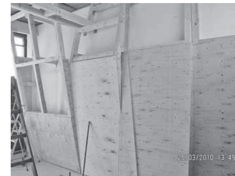
Tvorba dřevěné konstrukce.