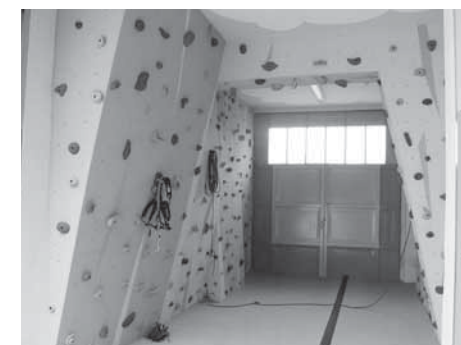
Finální stav - stěna v celé své kráse.