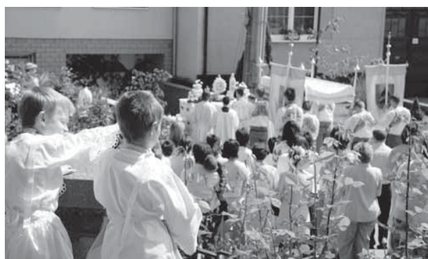
Také tento rok se uskutečnil průvod vesnicí jako součást slavnosti Těla a Krve Páně (Boží Tělo).