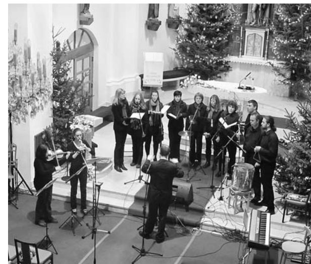
Vystoupení souboru Danielis z Rousínova