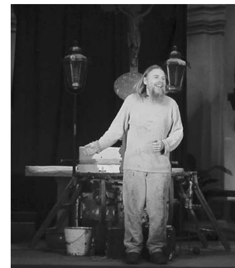
Hra Moravské pašije od Víti Marčička