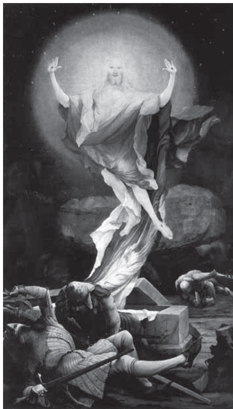
Matthias Grünewald, Zmrtvýchvstání (1515)

Milosrdenství velebme, za ně Boha vždycky chvalme, od věků nás Bůh miluje, milosrdenství zjevuje.