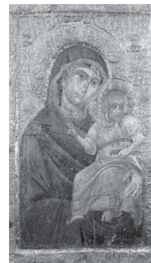
Bohorodička s Kristem, polovina 14. stol.

Ikony můžeme většinou vidět buď jako fresky na zdech pravoslavných kostelů a klášterů nebo spíše jako součást jejich liturgického prostoru – ikony jsou zasazeny ikonostasu. Vrcholná ikonografická díla vznikla v Byzanci a v Rusku, ikony se však psaly i v ostatních pravoslavných zemích – v Bulharsku, Rumunsku, Srbsku, Egyptě a Etiopii, v Gruzii a Arménii, i na východním Slovensku. Jedna z vel-