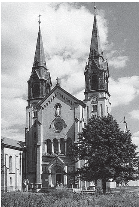
Bazilika Panny Marie Pomocnice křesťanů