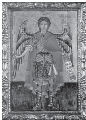
Archanděl Michael, 1742

kých ikon se například také nachází ve Svaté zemi – byla vyrobena u příležitosti konání I. církevního sněmu. Za nepřekonatelnou se však považuje ikona Nejsvětější Trojice od Andreje Rubleva z 15. století v ruském Vladimíru. Na ní jsou vyobrazeny tři Božské osoby, uprostřed nich je namalována eucharistie.