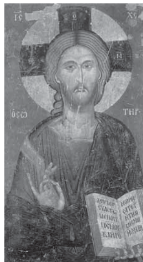
Kristus Spasitel, začátek 16. stol.

Ikona je nositelem vysokého náboženského a etického ideálu, proto člověk, který se chce stát ikonopiscem, musí žít vzorným duchovním a morálním životem. Měl by být pokorný, mírný, milovat Boha, neměl by být hrabivý ani závistivý. Je důležité, aby se na tuto práci dobře připravil a teprve až jeho dílo posoudí