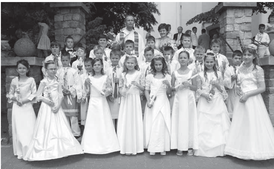
Třetřáci, kteří přijali 7. června poprvé Krista ve svatém přijímání: