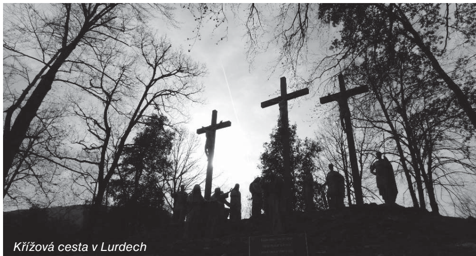
Křížová cesta v Lurdech