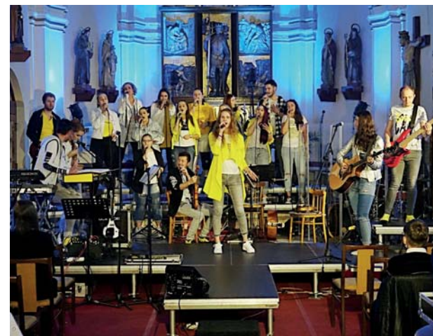
Záběry z koncertu v našem kostele