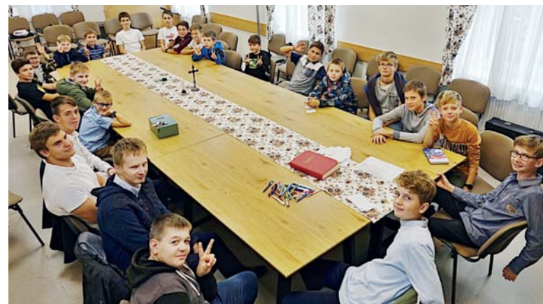
Děkujeme ministrantům za jejich celoroční službu. A jsme moc rádi, že jich je u oltáře tolik.

byli mezi prvními v Betlémě, když se narodil Ježíšek jedno ze dvou zvířat u jesliček chrlí lávu psaní přechod přes řeku na podzim padá ze stromů